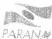
Airon Minoru Uchida